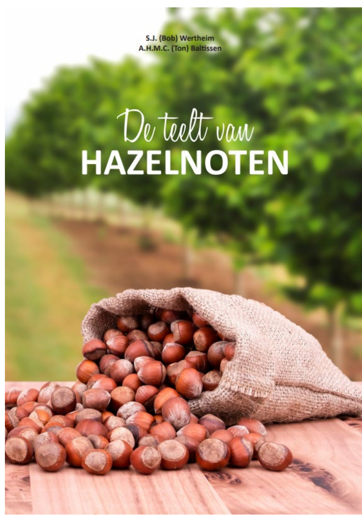
< Foto: Cover van het boek De teelt van hazelnoten (S.J. Wertheim en A.H.M.C. Baltissen) Zie ook nieuws van CropEye / LTO Noord