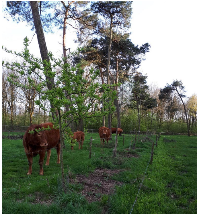
^ Afgerasterde jonge aanplant in het gedunde dennenbos.